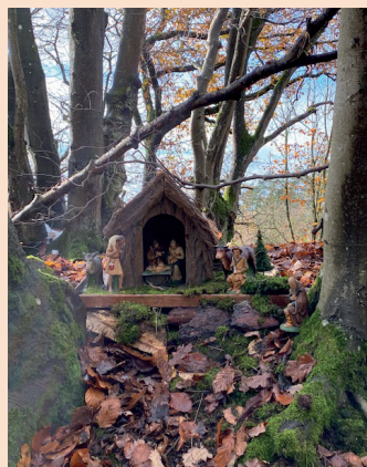
Der Weihnachtsbaum 2022 und eine Krippe am Krippenweg.