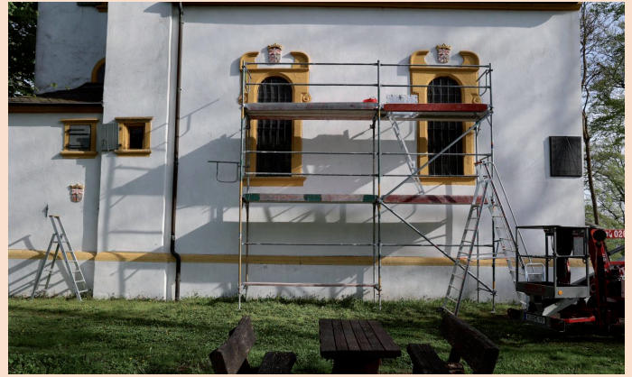
Ohne Gerüst ging es nicht. Die Detailarbeiten an den Wappen erforderten Standfestigkeit, denn eine ruhige Hand war Voraussetzung für das Gelingen der diffizilen Arbeiten.

Die Gesamtkosten für die Restaurierungsarbeiten, Gerüstauf- und abbau, Hubwagen usw. beliefen sich auf ca. 4.000 €. Eine gut angelegte Summe, die sich hoffentlich in einer langen „Lebensdauer“ der restaurierten Wappen widerspiegelt.