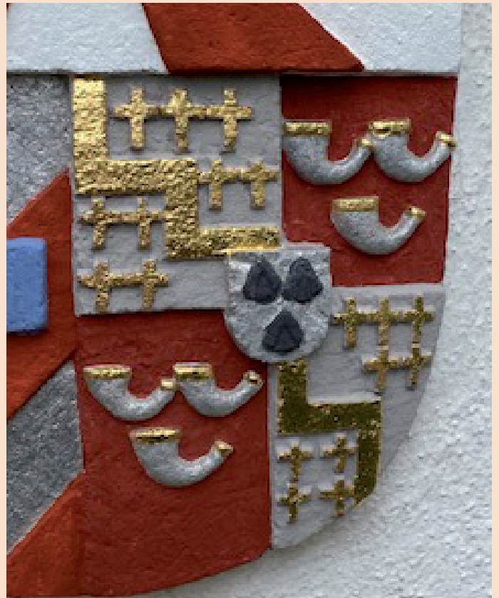
Ein Ausschnitt aus dem Allianzwappen über dem Portal zeigt die filigrane Ausarbeitung der verschiedenen Farbe.